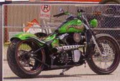
DREAM SMASHER Springer compressé