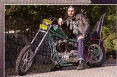
ACID QUEEN FredZebuth a croqué !