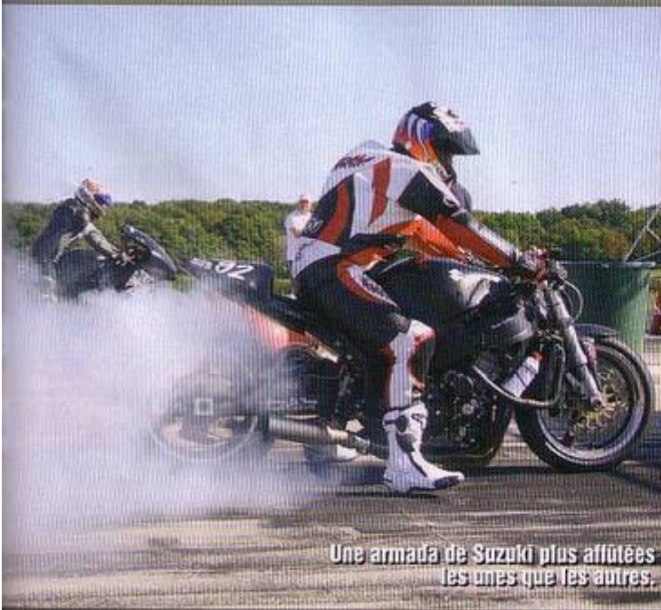
Une armada de Suzuki plus affûtées les unes que les autres.